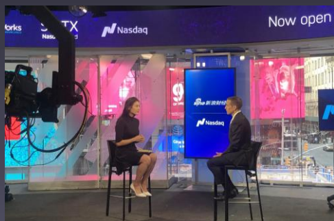
·纳斯达克交易所演播间