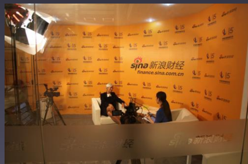
·中国发展高层论坛演播室