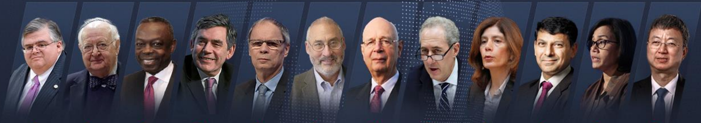
• 奥古斯丁·卡斯滕斯 国际清算银行总经理